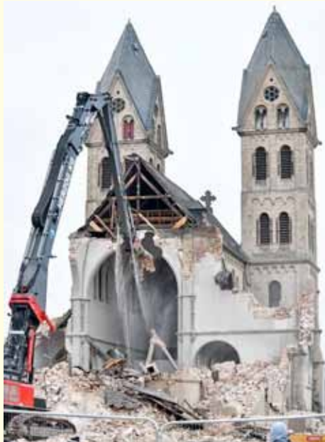
Kirchenabriss in Deutschland – aus der Kirchenzeitung des Bistums Hildesheim

Wie ist es so weit gekommen? Darauf bekam ich eine Antwort: Sie wurde einfach nicht mehr gebraucht. Es kamen keine Leute mehr. Sie konnte finanziell nicht mehr erhalten werden. Die Reportage zeigte auch, was mit dieser Kirche geschehen ist: Ein Jahr darauf kamen Bagger und verrichteten ihre Arbeit, sie rissen die Kirche ab.